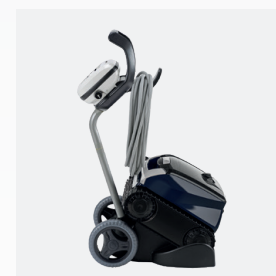
Carrello di trasporto