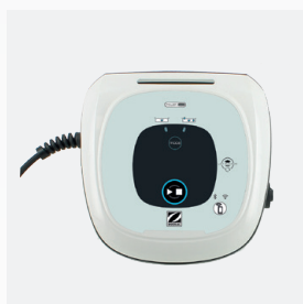
Scatola di comando